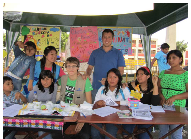
Mit der Kindergruppe der Komune "Los Aquijes"