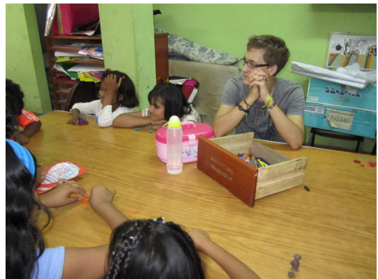
Bei einer Taller ("Sitzung") im Casa del Niño