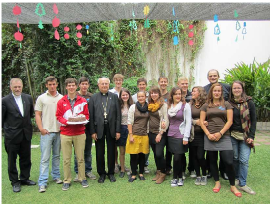
Der Erzbischof mit uns Voluntarios

Am Samstag gab es dann grosses Programm zur Partnerschaft, mit verschiedenen Staenden und Festreden.